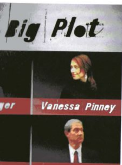
A sinistra, The Big Plot , 2008, installazione, dimensioni variabili, particolare. Sopra, Open society structures - Algorithms tryptic , 2009, tre stampe digitali su plexiglas, cm 54x39 ognuna.

Cirio si può definire come artista che lavora con i materiali dei media e dell'informazione, secondo un approccio estremamente innovativo. Il suo lavoro decostruisce il linguaggio dei media contemporanei che hanno portato a una nuova cultura della partecipazione e della condivisione dei contenuti. The Big Plot , uno degli ultimi lavori di Cirio, è composto sia da una installazione nello spazio reale che da una piattaforma di fiction in rete che si basa su una complessa trama narrativa intessuta attorno a una storia di spionaggio con quattro protagonisti principali. L'utente esplora la storia investigando su internet e mettendo in azione nuovi elementi tratti dalle proprie pagine personali sui social network o dal proprio blog, diventando così parte integrante della storia stessa. Realtà e fiction, spazio reale e virtuale, identità reali e fittizie si confondono tra loro. Come in altri suoi lavori l'artista solleva così scottanti tematiche politico-sociali come la censura, la nozione di originalità, l'autorialità e la privacy nella società 2.0.